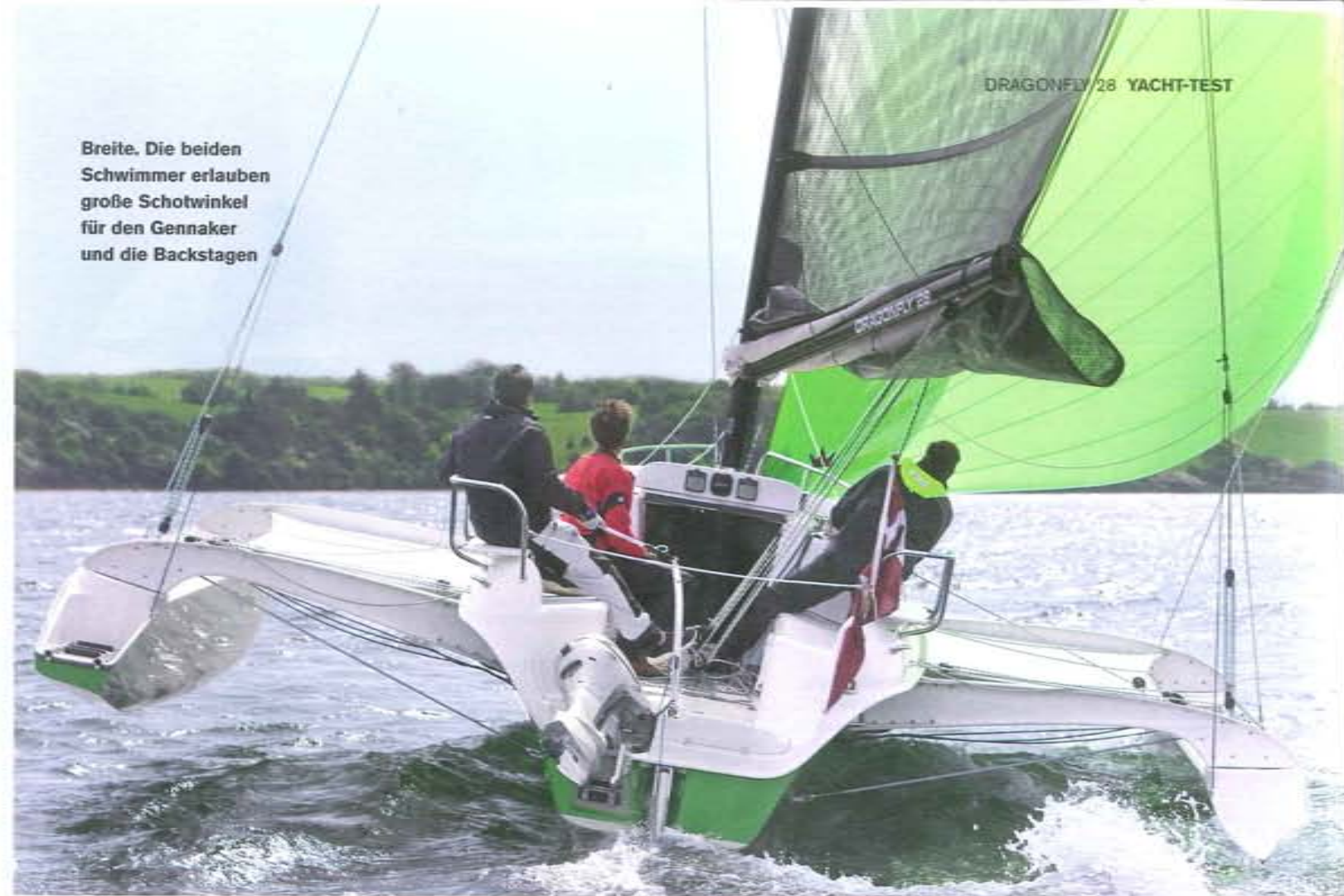
DRAGONFLY 28 YACHT-TEST

Der Dragonfly 28 vermag noch in anderen Punkten zu begeistern. Unter Motor zeigt